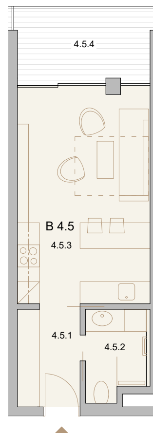
UMÍSTĚNÍ JEDNOTKY NA PATŘE